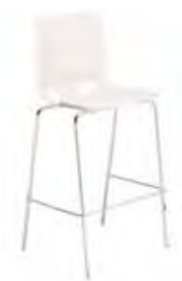
▶ FONDO hocker chrome