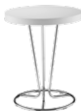
▶ PINACOLADA table chrome