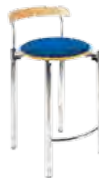
▶ BISTRO 78 plus chrome