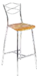
▶ DOLCE hocker wood chrome