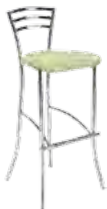
▶ MOLINO hocker plus chrome