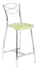
▶ DOLCE 78 chrome