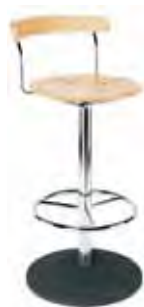
▶ BISTRO hocker chrome