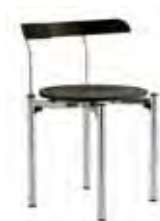
▶ BISTRO chrome