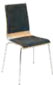
▶ CAFE VII plus chrome