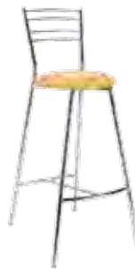
▶ ROSSO hocker chrome