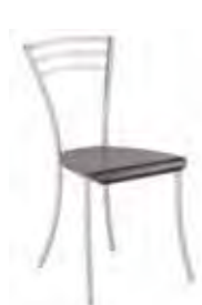
▶ MOLINO wood silver