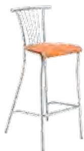
▶ BALENO hocker alu