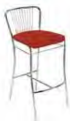
▶ NERON hocker chrome