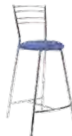
▶ ROSSO 78 chrome