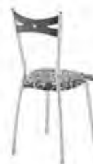
▶ FIAMMA silver