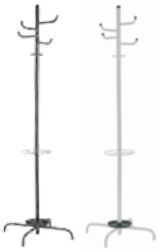
▶ 121 ARIZONA HANGER