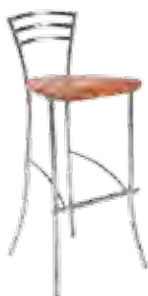
▶ MOLINO hocker wood chrome