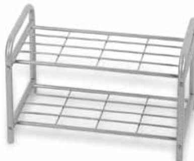
▶ POLO étagère à chaussure 600 alu