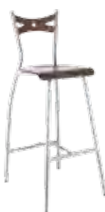
▶ FIAMMA hocker wood alu