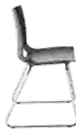
▶ FONDO cfs chrome