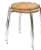
▶ maximum 6 pièces