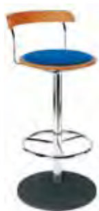
▶ BISTRO hocker plus chrome