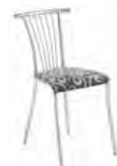
▶ BALENO silver