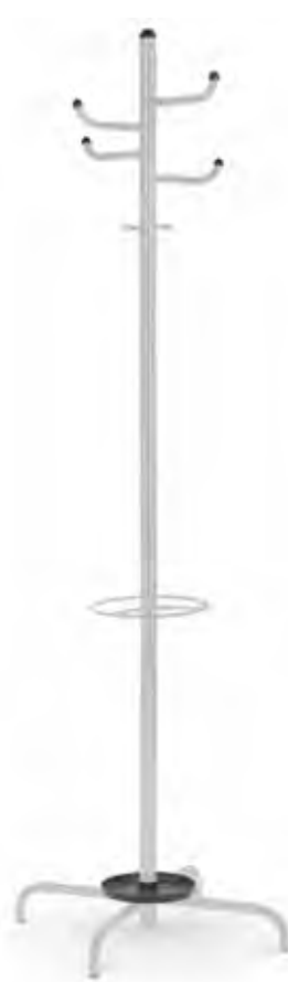
▶ ARIZONA alu