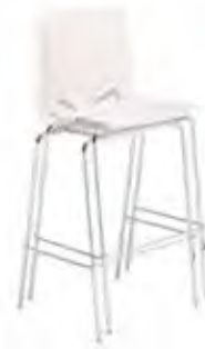
▶ maximum 6 pièces