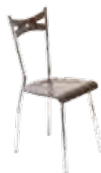
▶ FIAMMA wood chrome