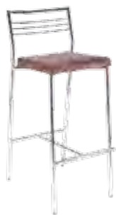
▶ CALDO hocker chrome