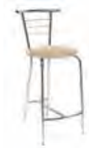
▶ 118 ARANCIA HOCKER