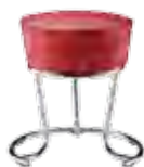
▶ PINACOLADA stool chrome