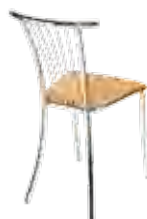
▶ BALENO chrome