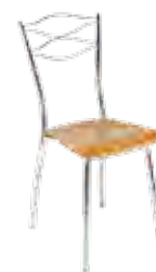
▶ DOLCE wood chrome