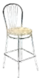
▶ VEGA hocker wood chrome