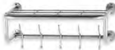
▶ POLO porte manteau 600 alu