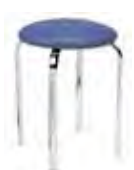
▶ ZEPPO chrome