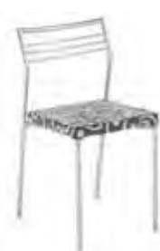
▶ CALDO silver