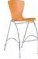
▶ 105 BINGO HOCKER