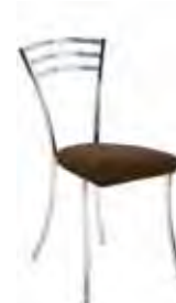
▶ MOLINO plus chrome