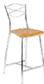
▶ DOLCE 78 wood chrome