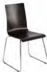
▶ CAFE VII cfs chrome