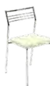
▶ CALDO chrome