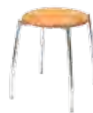
▶ GRAPPO chrome