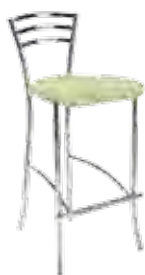
▶ MOLINO 78 plus chrome