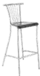
▶ BALENO hocker wood alu