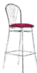
▶ VENUS hocker chrome