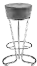
▶ PINACOLADA hocker chrome