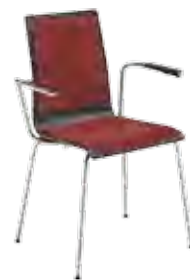
▶ CAFE VII arm plus chrome