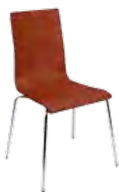
▶ CAFE VII chrome