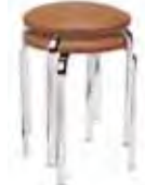
▶ maximum 6 pièces