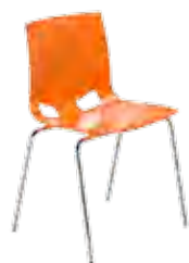
▶ FONDO chrome