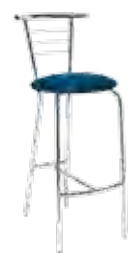
▶ ARANCIA hocker chrome