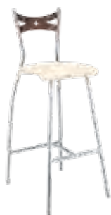
▶ FIAMMA hocker alu