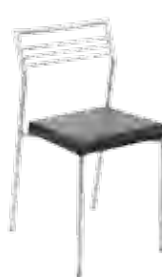
▶ CALDO alu