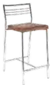
▶ CALDO 78 chrome