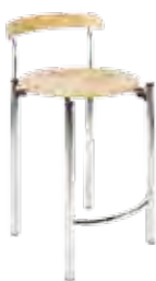
▶ BISTRO 78 chrome