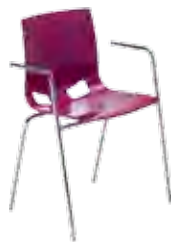
▶ FONDO arm chrome