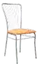
▶ NERON alu