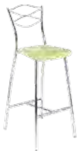
▶ DOLCE hocker chrome