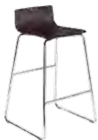
▶ CAFE VII hocker chrome