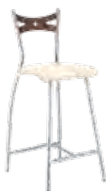
▶ FIAMMA 78 alu