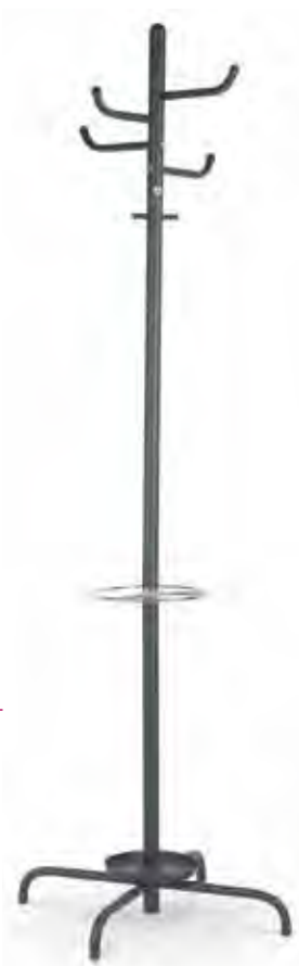
▶ ARIZONA black