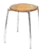
▶ GRAPPO wood chrome