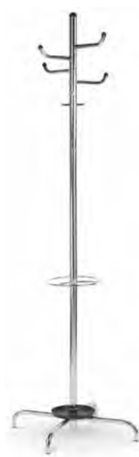
▶ ARIZONA chrome