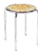
▶ RINGO chrome