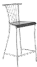
▶ BALENO 78 wood alu