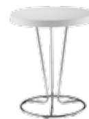
▶ PINACOLADA table chrome

TABOURETS DE BAR, TABOURETS, ACCESSOIRES