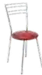
▶ ROSSO chrome